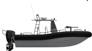
RAL-750-ZSF-OPEN ( Aister )

Autonomía, 340 millas Tripulación, 4 defensa-cintón perimetral flexible no anegable, de 250 mm de radio